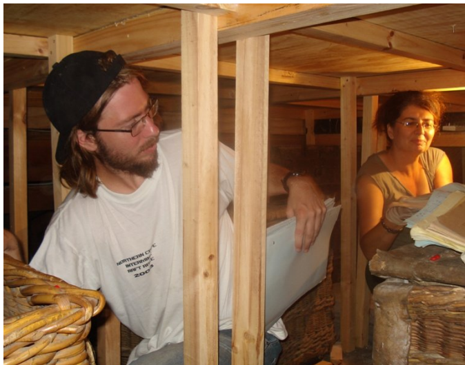
'n Ketting van hande hanteer die dokumente stuk vir stuk